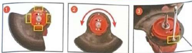
Helyezze a tereflóapot a nyílásba