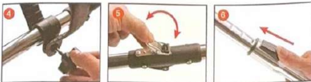
Csatolja be a fogantyút a rúdba, állítsa be a megfelelő pozíciót, helyezze be a csavart és húzza meg