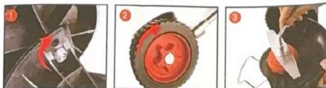
Igazítsa az anyákat a nyílás helyzetéhez